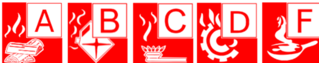
Kuva 1: Käsisammuttimien teholuokat kertovat, minkä tyyppisiä paloja sammuttimella voi sammuttaa.