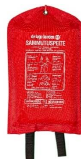
Kuva 7: Sammutuspeite

Sammutuspeite sopii pienten palonalkujen ja ihmisten päällä olevien vaatteiden sammuttamiseen tukahduttamalla. Suositeltava koko on vähintään 180 x 120 cm.