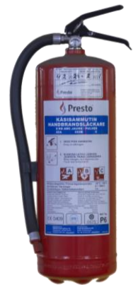
Kuva 3: Jauhesammutin

Jauhesammutin on hyvä yleissammutin lähes kaikkiin paloihin. Huonona puolena voidaan pitää sammutusaineen likaavuutta; hienojakoinen pöly voi aiheuttaa esim. sähkölaitteille suurta vahinkoa. Likaavuuden vuoksi jauhesammutinta ei suositella tiloihin, joihin voi kohdistua ilkkivaltaa.