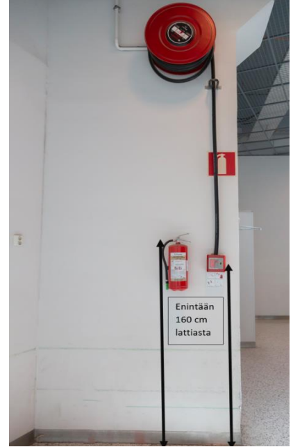
Kuva 9: Sammuttimen kahvan ja pikapalopostin letkun pään sijoitus lattiapinnasta

Myös pikapalopostin sijoituskorkeudessa on huomioitava, että letkun saa helposti lattiatasosta käyttöön. Pikapalopostikaappi sijoitetaan siten, että kaapin alareuna on enintään 120 cm korkeudella lattiapinnasta. Ylemmäs sijoitettavan pikapalopostikelan alas laskeutuvan letkun pää tulee sijoittaa enintään 160 cm korkeudelle lattiapinnasta.