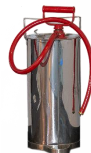
Kuva 6: Sankoruisku

F-luokan sammuttimet on suunniteltu estämään rasvan uudelleen syttyminen. Sammutusvaikutus perustuu palokaasujen eristämiseen sekä tukahduttamiseen. F-luokan sammuttimella on aina myös A- ja/tai B-luokitus. Mikäli F-luokan sammutin on ammattikeittiön ainoa sammutin, on huomioitava riittävä teholuokka myös A- ja/tai B-luokituksessa. Elintarvikepalosammuttimet sopivat keittiötiloihin.