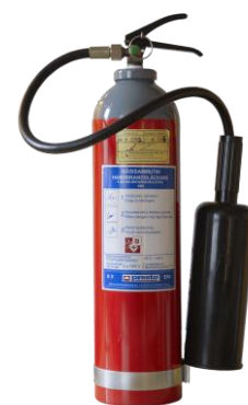
Kuva 5: Hiilidioksidisammutin

Hiilidioksidin sammutusvaikutus perustuu sekä tukahduttamiseen että jäähdyttämiseen. Hiilidioksidisammutin sopii huonosti käytettäväksi ulkoilmassa. Hiilidioksidisammuttimella on turvallista sammuttaa jännitteisiäkin kohteita ja siksi se sopii hyvin mm. atk-, tele- ja sähkötiloihin.